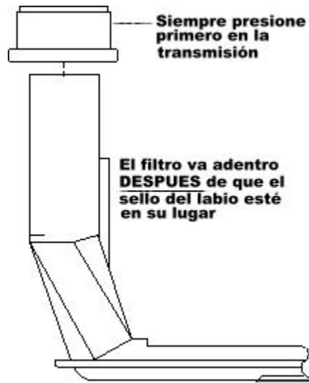
Filtro con sello de labio

Siempre haga referencia al manual de instalación del fabricante cuando se disponga de este.